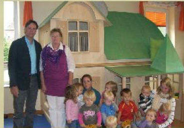
Sachspende Villa Kunterbund