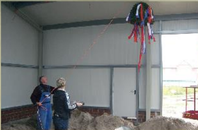
Richtfest – Reinders neue Halle