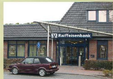
Herzlich willkommen! Neuer Kunde der Reinders Gebäudereinigung ist die Raiffeisenbank Wiefelstede